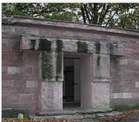
Kyrkogården i Langemarck.

Under 1928 till 1932 renoverades kyrkogården i Langemarck där de fallna soldaterna i dag ligger. Den byggdes i sten och stilen var monumental, vilken skulle ge en känsla av evighet. Denna arkitekturstil var ganska vanlig under 30-talet och blev mycket betydelsefull i det tredje riket. År 1936 byggdes Olympiastadion i Berlin i samma stil, och man invigde där en hall där de fallna soldaterna skulle vördas.