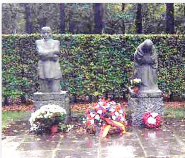
Statyer som visar Käthe Kollwitz och hennes man som sörjer den döde sonen. Sök hennes namn på nätet för mer information.

I Berlin finns ett vakthus – Neue wache – som i dag används för att hedra alla som har fallit offer för krig och våld. I detta hus finns en staty av Käthe Kollwitz.