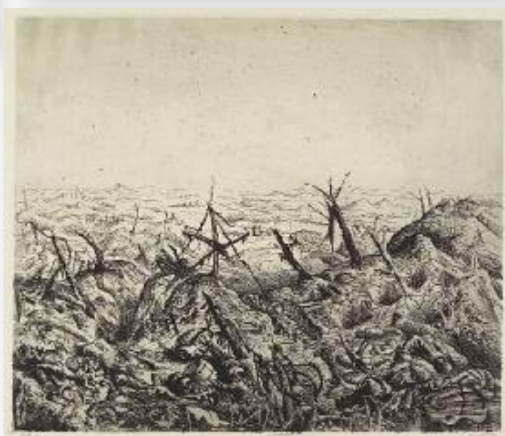
"Nära Langemarck" och "Ruinerna i Langemarck" skapades 1924 av Otto Dix och ingår i serien "Der Krieg". Nästan samtliga förstördes av nazisterna. Fler bilder kan ni själva googla fram och historien om denna mans liv kan ni själva läsa om på nätet.