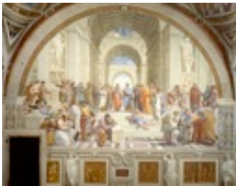
Raphael - Skolan i Aten

Med renässansen växte nya idéer om människan och naturen fram. Man lyfter åter fram antika ideal. Man börjar skilja det världsliga från det andliga. I reformationen vänder sig många mot den katolska läran. Med motreformationen gick den katolska kyrkan till motoffensiv.