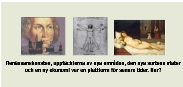
Renässanskonsten, upptäckterna av nya områden, den nya sortens stater och en ny ekonomi var en plattform för senare tider. Hur?