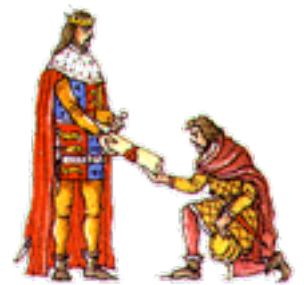
En kung av guds nåde

I de allra flesta länder i Europa försökte kungen stärka sin ställning och centralisera makten. Kungarna började hävda att de fått makten av Gud, "av Guds nåde", och att de därför skulle vara eväldiga.