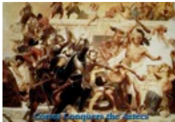
Cortez erövrar Tenochtitlan

Från mitten av 1400-talet och framåt ger sig europeiska sjöfarare ut på allt längre seglatser. Man upptäcker sjövägen till Afrika, upptäcker nya kontinenter och för hem ett växande antal varor och rikedomar. När vårt avsnitt börjar, cirka år 1500, är Europa inte det rikaste området på jorden. Ett par hundra år senare, cirka år 1750, har Europa blivit världens rikaste område.