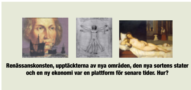
Renässanskonsten, upptäckterna av nya områden, den nya sortens stater och en ny ekonomi var en plattform för senare tider. Hur?