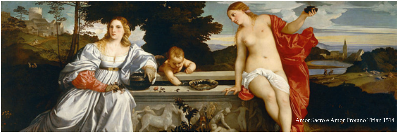
Amor Sacro e Amor Profano Titian 1514