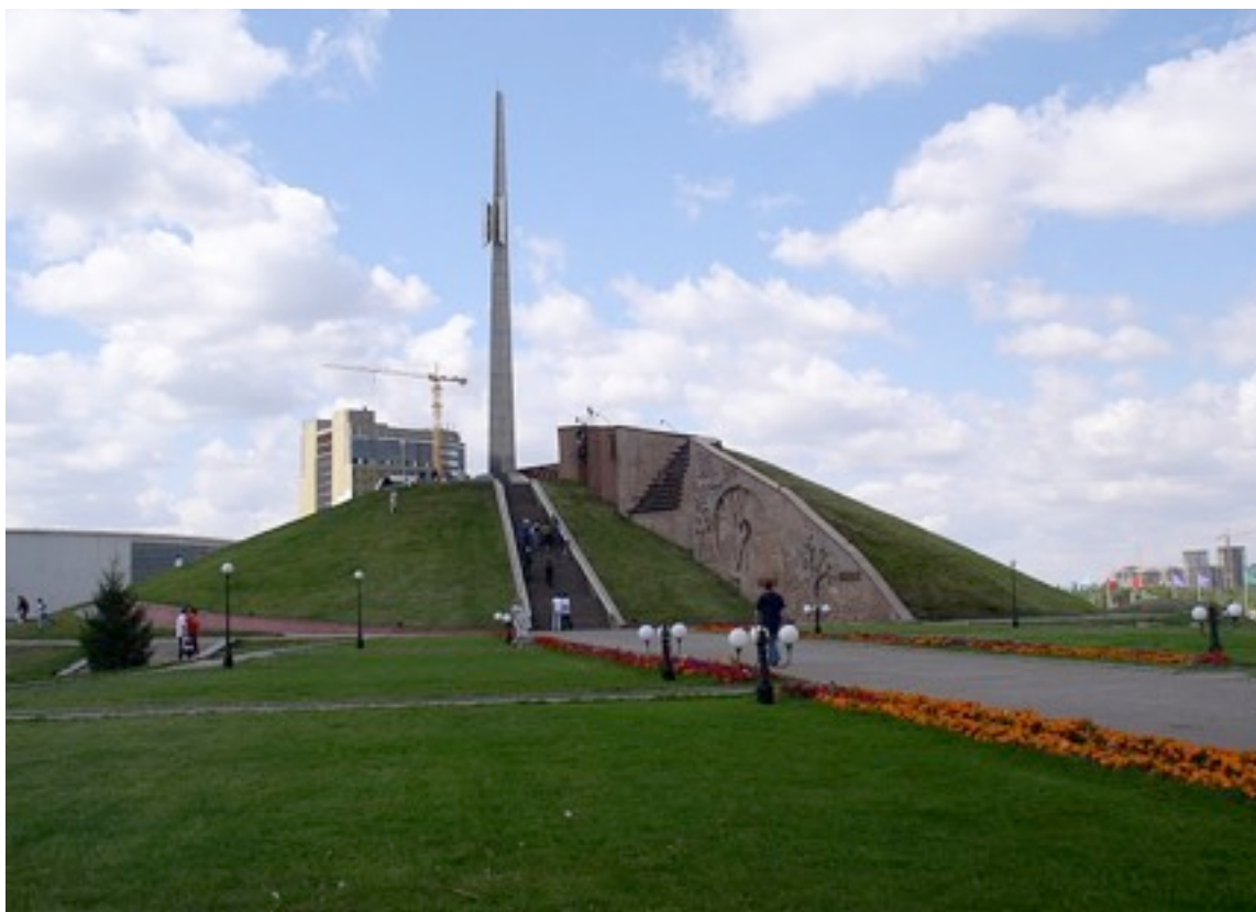
Minnesmärke över offren i GULAG, Kazakstan