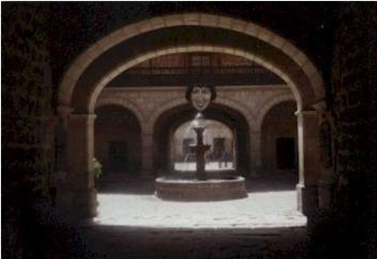
Myntverket i Potosi. Här slogs silvermynt ända fram till 1953.